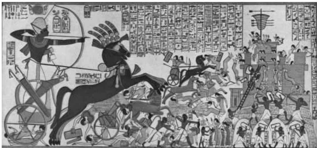
«Взятие Дапур». Храм фараона Рамсеса II (1279–1213 до н.э.). Фивы, Египет

Обязательные компоненты мифологии этноса – «почва» и «кровь» – соотносятся с низшими слоями ментальной триады древних греков (растительный, животный, разумный уровни), сформулированной в трудах Платона и Аристотеля. Миф этничности локализован в тех безличных пластах психики, которые Фрейд именовал «оно» ( id ), а Юнг – коллективным бессознательным. Отсутствие в структуре этнического сознания индивидуализирующего «разума» свидетельствует, что известное сравнение со стадным чувством адекватно описывает природу этнического национализма.