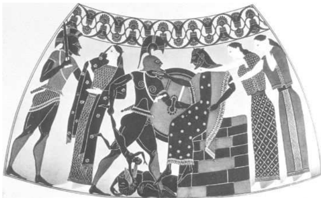
Роспись амфоры. V век до н.э. Греция

Моральное оправдание уголовных преступлений «своих» в отношении «чужих» не исключение, а скорее правило этнического сознания. «Они» всегда злоумышляют и совершают злодеяния первыми. Нападая на них сегодня, «мы» только восстанавливаем историческую справедливость, нарушенную ими в палеолите, или же предупреждаем их неминуемую будущую агрессию. «Их» вина перед «нами» всегда больше «нашей» перед «ними». Двойные этнические стандарты формируют убеждение, что представители других этносов являются либо людьми не как мы, либо не совсем людьми, либо нелюдьми, животными.