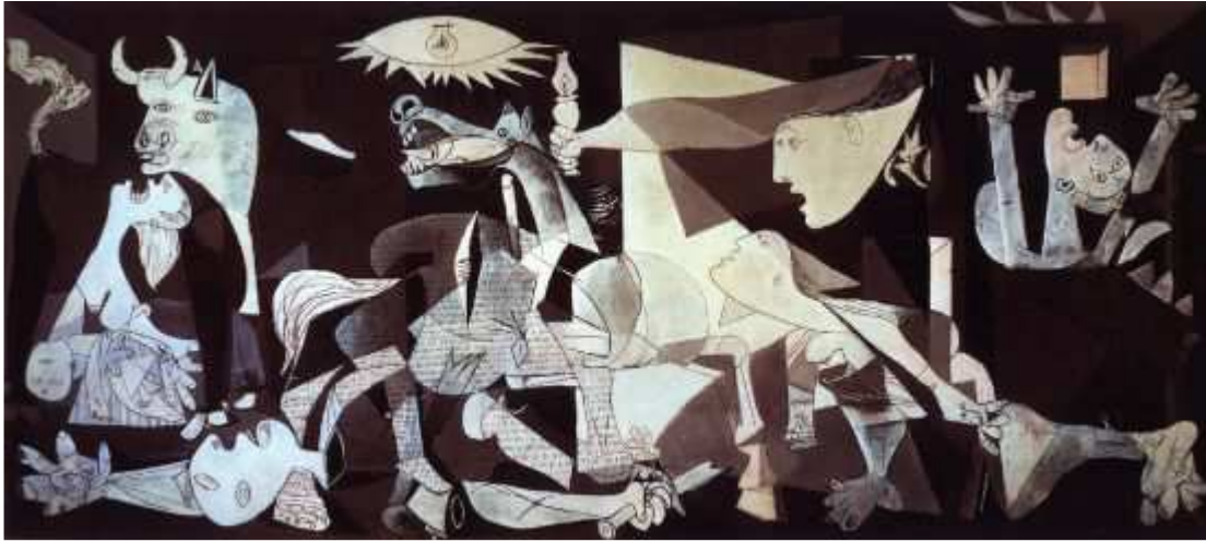
Пабло Пикассо. «Герника». 1937