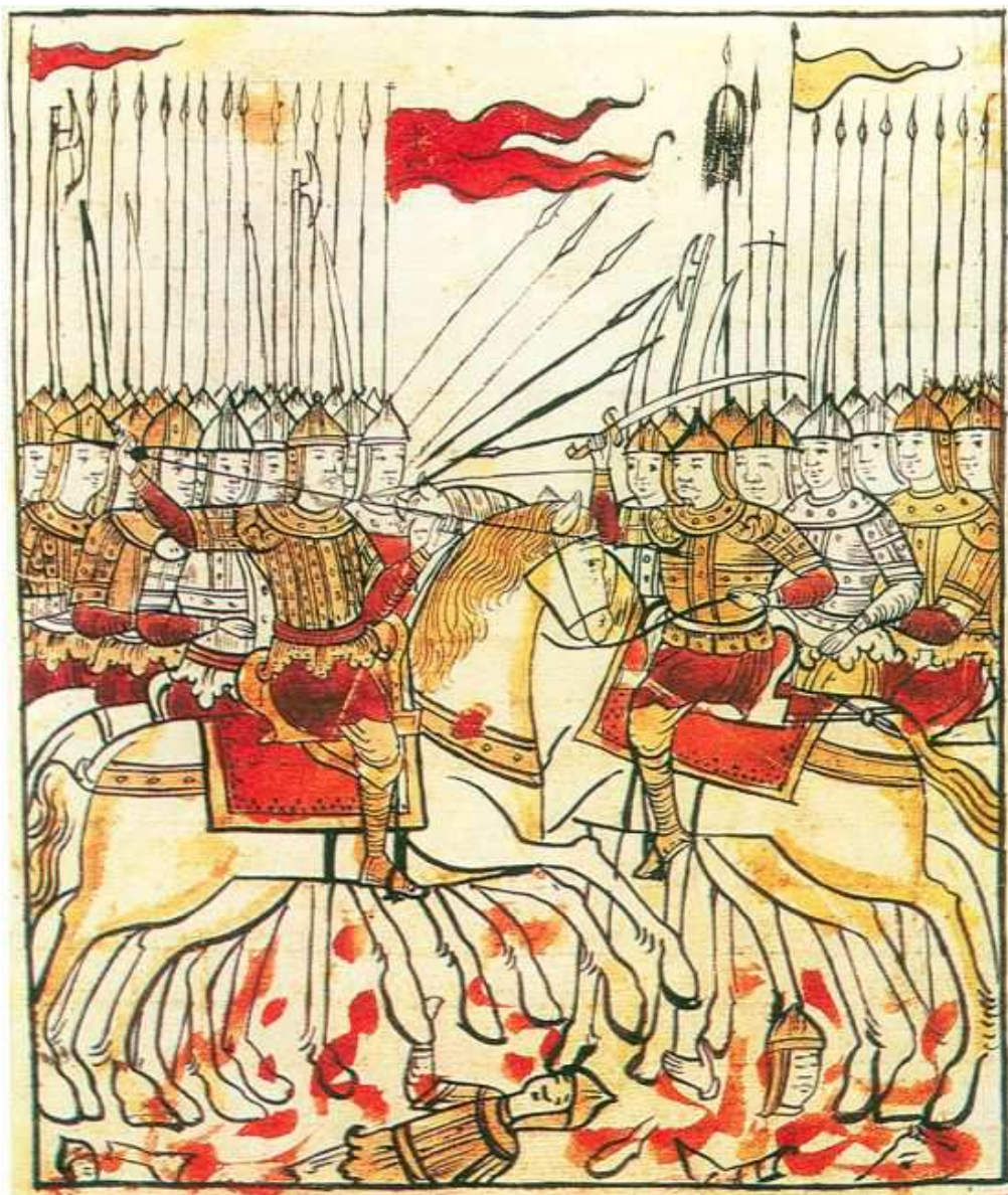
«Битва на Куликовом поле». Из рукописи «Сказание о Мамаевом побоище». XVII век

[1] См.: Буртин. Шура. Топором и пером. Почему, чтобы стать совестью нации, надо стать врагом народа. – «Русский репортер», 2013, № 45. http://rusrep.ru/article/2013/11/10/aylisli/