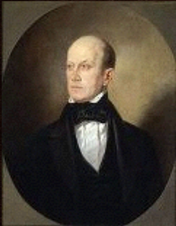
Пётр Яковлевич Чаадаев

Проблема Чаадаева –это проблема о русских и о судьбах России. Она породила течение «западников» или либералов и течение «славянофилов» в русской культуре. Рефлексия этих течений и на уровне элит, и на уровне обыденных практик породила конфликт. Мировоззренческий конфликт. К сожалению, этот конфликт стал нагружаться взаимной ненавистью и презрением. Сегодня проблема Чаадаева и системного раскола российского общества на «западников – либералов» и «славянофилов – патриотов» обострилась как ни когда. Это плохой симптом. Он всегда предвещал смуту, распри и революции.