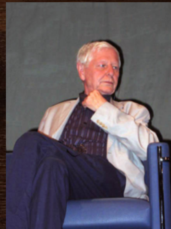
Энценсбергер, Ганс Магнус